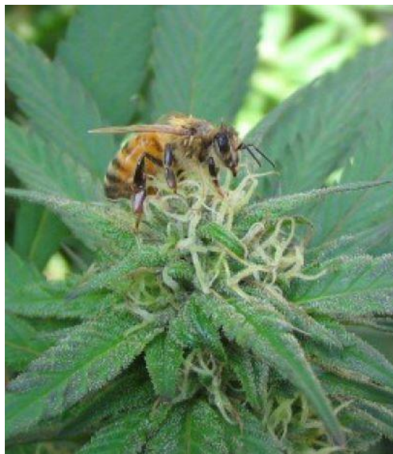
Une abeille butinant un plant de cannabis ardéchois